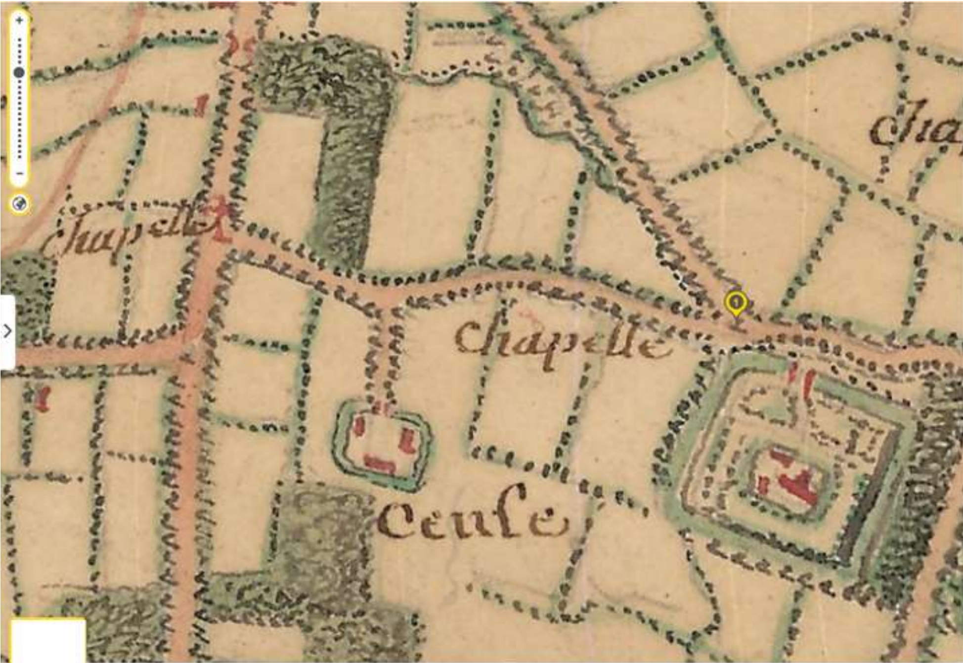
Kaart 1745 -1748